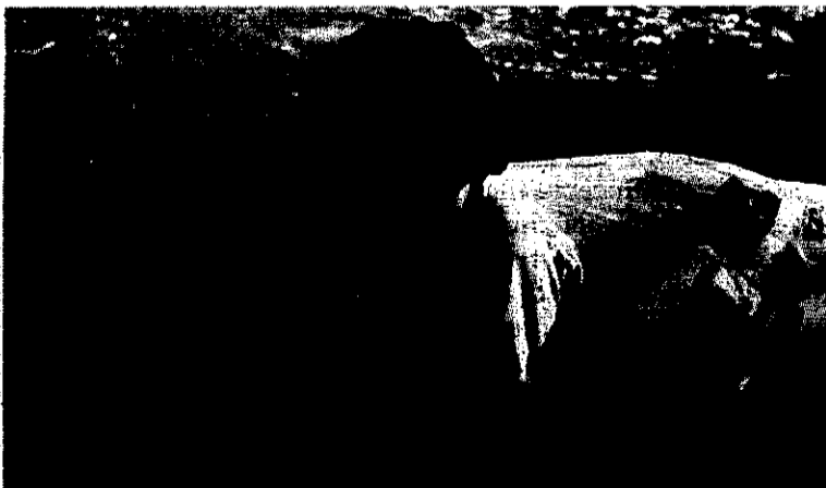
Primează ajutoare pe timpul iernii